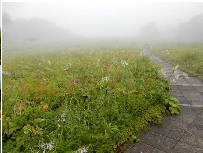
トレッキング入り口付近