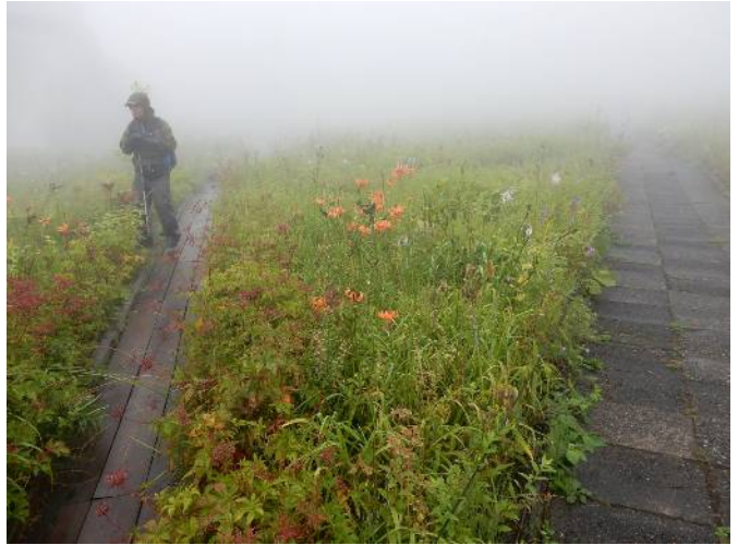
高山植物園内の花