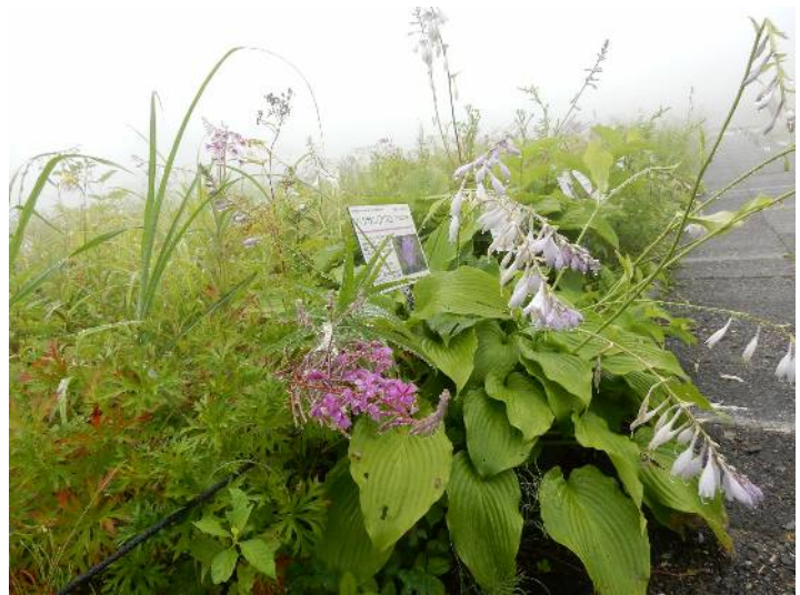
高山植物園内の花