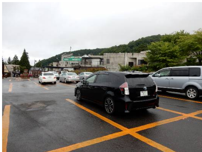
白馬五竜の駐車場

木道の道が続き滑り易い中を下って行き登りとの分岐を過ぎると高山植物園になり花を見ながら9時32分アルプス平に帰り着く、テレキャビンで麓に降りる。