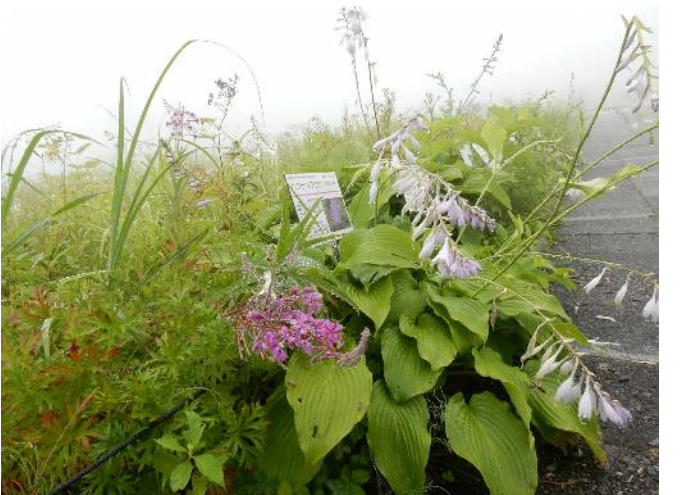
高山植物園内の花