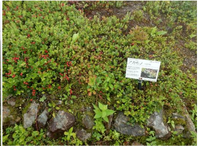
高山植物園内の花